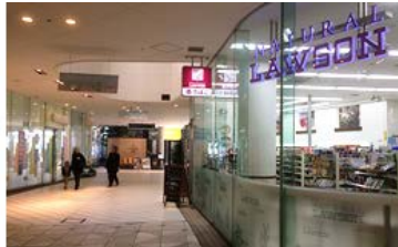
カルディコーヒー、ナチュラルローソンを通過します。