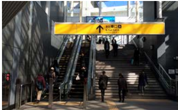
横浜駅「きた東口」からエスカレーターを上り、ベイクォーターへ進みます。