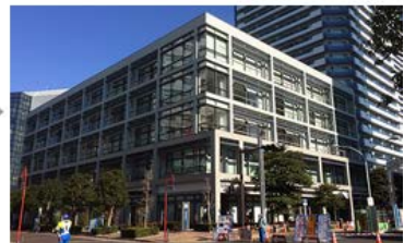
1Fに横浜銀行があるビルの3Fへおいでください。