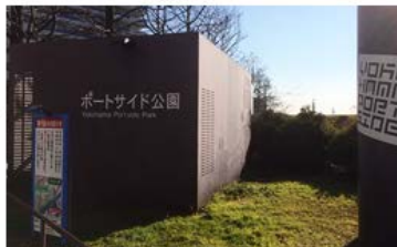
ポートサイド公園の前の信号を渡ります。