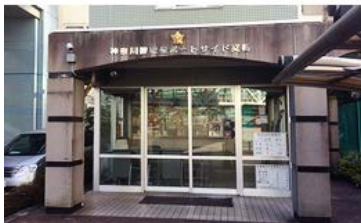
歩道橋の階段を降りると右手に交番があり、さらに進むとセブンイレブンがあります。