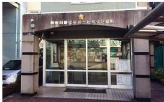
歩道橋の階段を降りると右手に交番があり、さらに進むとセブンイレブンがあります。