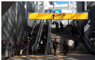
横浜駅「きた東口」からエスカレーターを上り、ベイクォーターへ進みます。