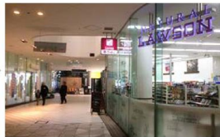
カルディコーヒー、ナチュラルローソンを通過します。