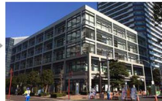
1Fに横浜銀行があるビルの3Fへおいでください。