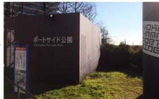
ポートサイド公園の前の信号を渡ります。